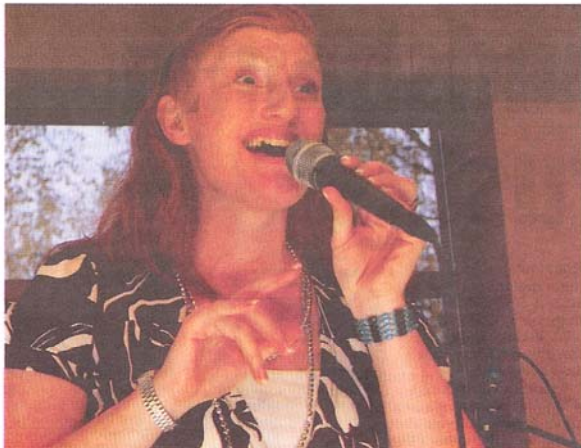
Sångerskan Zoie Finers briljans och spontana utstrålning utgjorde ett härligt vokalt nav när hon med sin kvartett bjöd på "Jazz à la carte" i Andreasgården.